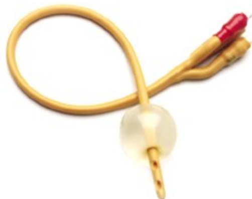
Fig. 1: Een Foley-katheter

Dit wordt ook wel 'primen' genoemd. Een methode om de baarmoedermond rijp te maken is het inbrengen van een Foley-katheter (een dun slangetje) in de baarmoedermond. In de top van dit slangetje zit een klein ballonnetje dat na het inbrengen met water wordt gevuld. Door de druk van het ballonnetje komen natuurlijke hormonen vrij die de rijping van de baarmoedermond